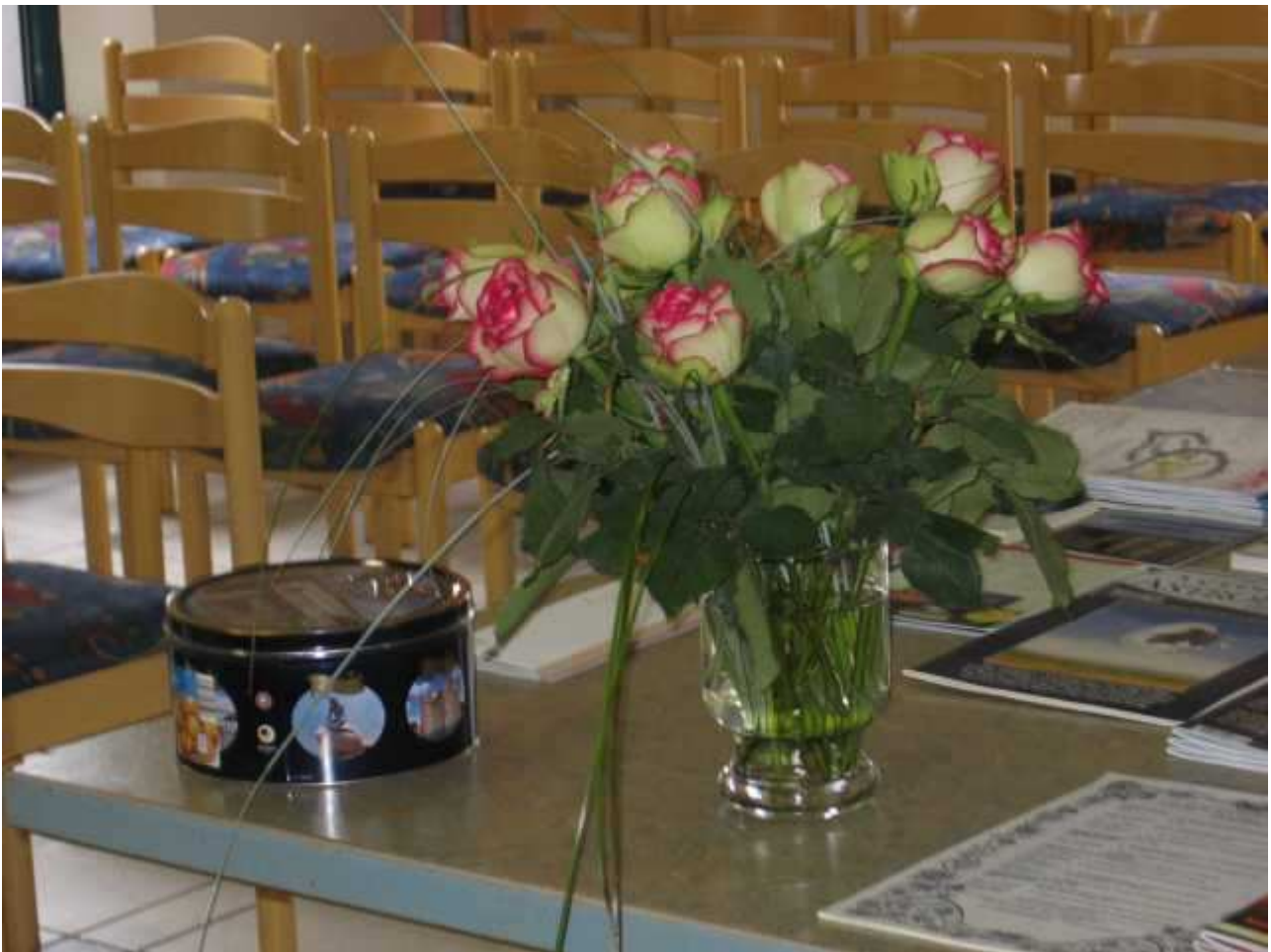
Teilansicht des Tagungsraumes