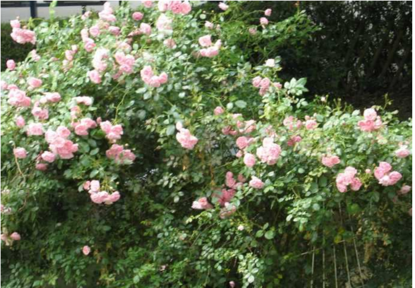
Der schöne reichblühende Rosenstrauch im Garten des Tagungshauses