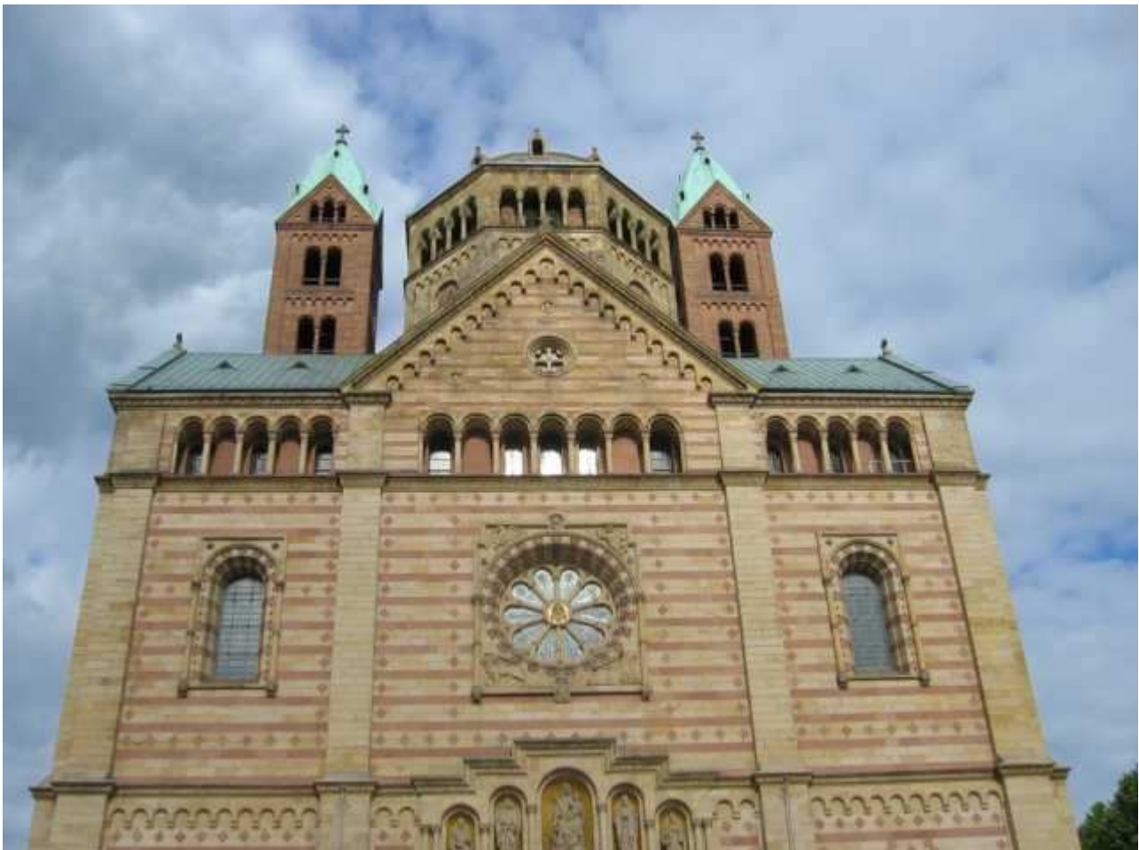
Fotos: Helga Sobek - Nachdruck, kopieren, Weitergabe - nur auf Anfrage und für die Teilnehmer der 8. Tagung 2015 - 9