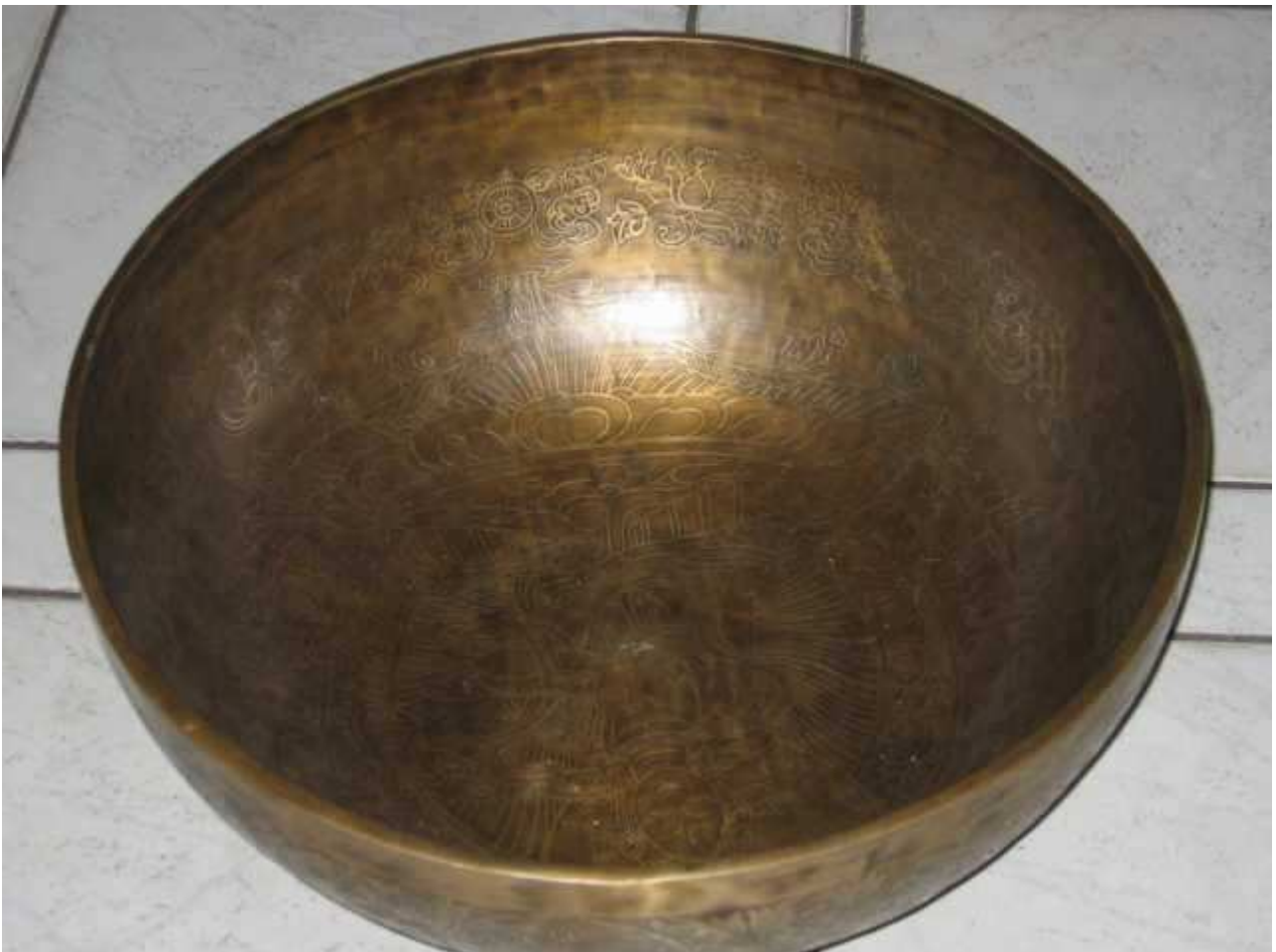
Die sehr grosse Klangschale aus der Aurabehandlung von Rolf Liefeld