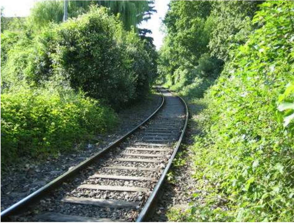
in Speyer

Das 10. IFA-Jahrestreffen wieder in Speyer von Frei. 14.07. bis So. 16.07.2017 Kurzseminare ab Mo. 10.07. bis Do. 13.07.2017