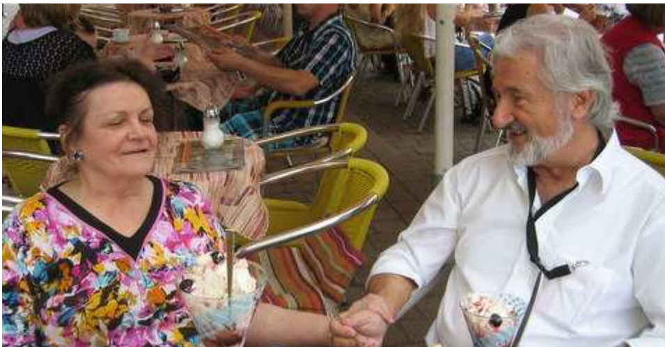
Foto 26.06.16 in Speyer nach Ende der Tagung