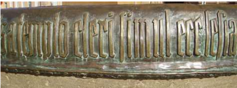
Inschrift auf dem Brunnen-Rand aus dem lat. übersetzt:

Der Domnapf , selten auch Domschüssel , ist eine große steinerne Schale vor dem Kaiserdom der Stadt Speyer ( Rheinland-Pfalz ). Sie soll gemäß der Überlieferung nach jeder Neuwahl eines Bischofs „für das gesamte Volk“ mit Wein gefüllt werden. Der Napf fasst 1580 Liter und trägt eine lateinische Inschrift .