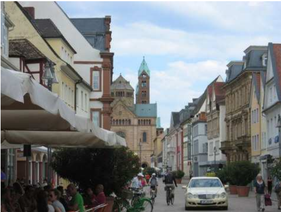
Maximilianstr. in Speyer