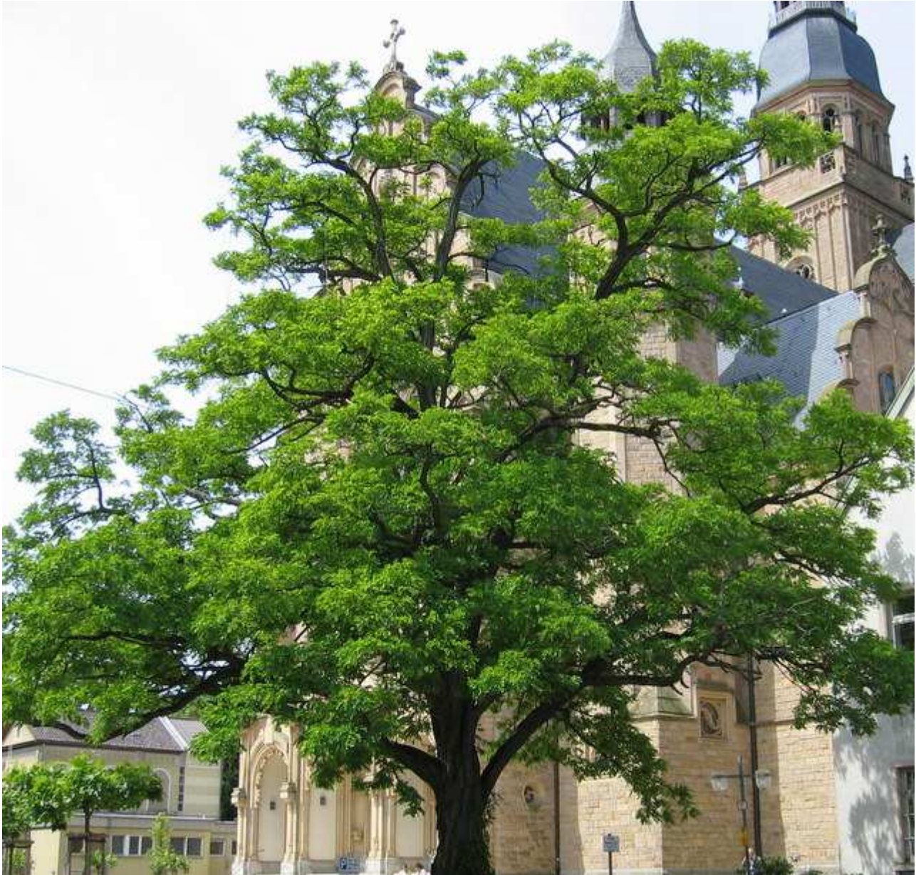
Speyrer Dom mit dem wunderschönen alten starken Baum

Nochmals herzlichen Dank an alle Referenten, die Ihre ausserordentlich guten Vorträge gehalten und lange Anfahrtswege (zum Teil per Flug) ohne Entgelt auf sich genommen haben. Auch im