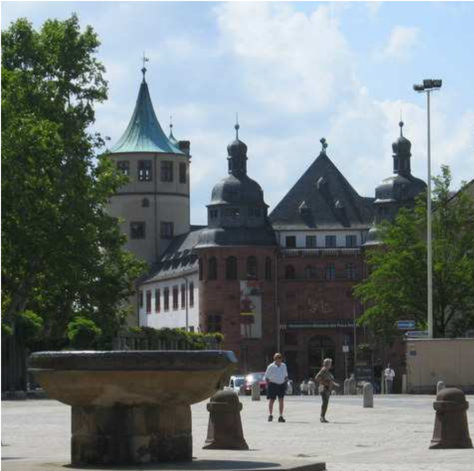
Domplatz Speyer

Der Domnapf , selten auch Domschüssel , ist eine große steinerne Schale vor dem Kaiserdom der Stadt Speyer ( Rheinland-Pfalz ). Sie soll gemäß der Überlieferung nach jeder Neuwahl eines Bischofs „für das gesamte Volk“ mit Wein gefüllt werden. Der Napf fasst 1580 Liter und trägt eine lateinische Inschrift .